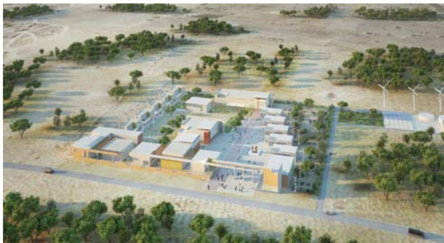
Maquette Projet Africa Sun Valley - conçue par l'équipe technique WecAfrica

Le concept AFRICA SUN VALLEY, initié par WECAFRICA, repose sur l'installation de pôles technologiques et industriels et autonomes en énergie propre dans les pays d'Afrique et vise à réduire progressivement sur 15 ans l'importation des équipements entrant dans la réalisation de projets en Afrique de 90 à 10%.