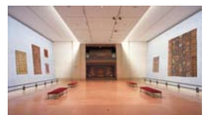
EXPOSITION temporaire Anthropometria - Mode et Science Du 19 octobre 2011 au 8 janvier 2012